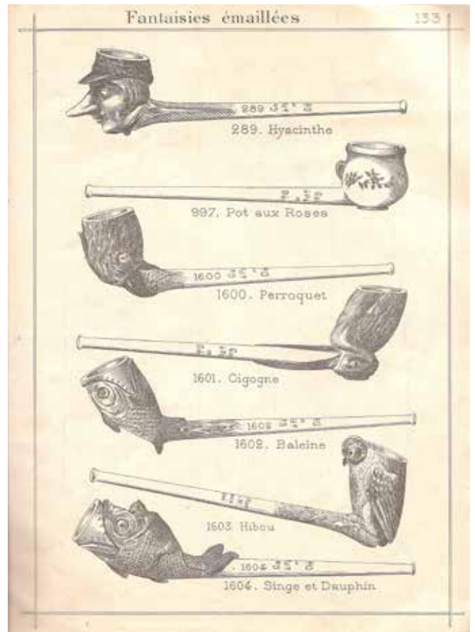
Afb. 8. Catalogus Gambier, 1905, p.133.

belangrijker om naast de relatief dure Gambier pijp ook een goedkoper alternatief aan te kunnen bieden. Gambier ondervond veel concurrentie van bedrijven zoals Scouflaire en Wingender Frères die goedkopere pijpen op de markt brachten. Zonder afbreuk te doen aan het prijsniveau van de Gambier modellen konden de klanten kiezen voor de goedkopere Noël. Zo kostte een Gambier ‘fantaisie’ (figurale, geëmailleerde steelpijp) 9 franc per gros, terwijl de met Noël gemerkte ‘fantaisie’ 6 franc per gros kostte. De prijs van een Jacob van Gambier bedroeg bijna het dubbele van de Noël variant.