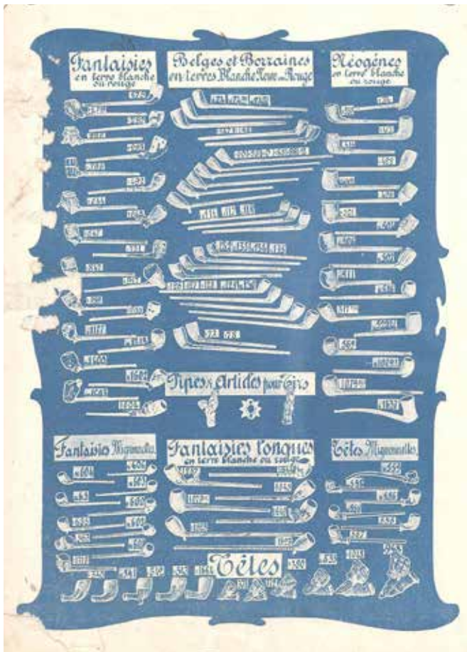
Afb. 7. Catalogus Gambier, 1908.