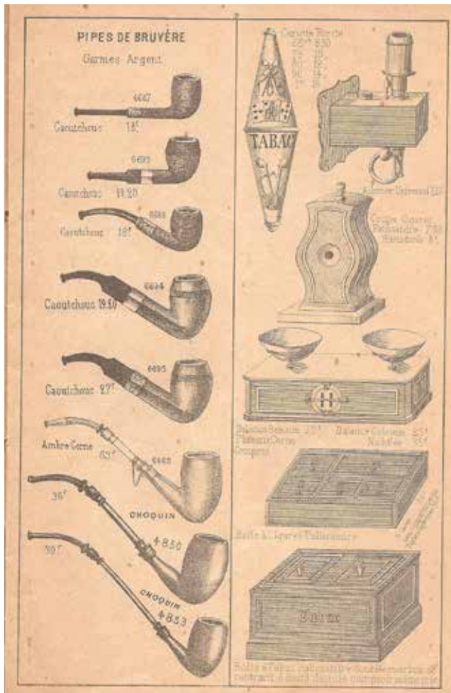
Afb. 5. Prijscourant Gambier, 1896.

liet vlak voor de overname door Gambier groeiende omzetcijfers zien en naast een vast klantenbestand in Frankrijk werd ook de export steeds belangrijker. Voor Gambier zal deze overname van groot belang zijn omdat die het klantenbestand uitbreidde en men gebruik kon maken van de bij Noël aanwezige productielijn van bruyère pijpen. We komen in de prijscourant van de latere eigenaren van Gambier (Quentin & Cie) uit 1896 voor het eerst een aanbod van houten pijpen tegen. (Afb. 5)