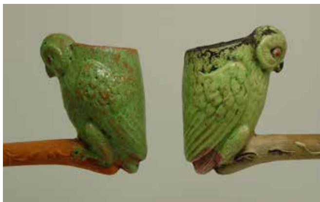
Afb. 9. Fantaisie Hibou, cat. nr. 1603, rode klei, Noël.

Een groep opvallende modellen uit de 1908 catalogus worden hier apart toegelicht. Deze pijpen werden in de catalogus van 1905 als een nieuwe serie Gambier pijpen met diervoorstellingen geïntroduceerd. (Afb. 8) Drie jaar later waren ze alleen nog verkrijgbaar als Noël pijp. Het gaat om de catalogusnummers 1600 (Perroquet), 1602 (Baleine), 1603 (Hibou) en 1604 (Singe et Dauphin). Het afwerkingniveau van deze pijpen is lager dan bij de oorspronkelijke Gambier modellen uit 1905. De Noël variant in rode klei is met minder zorg geëmailleerd dan de Gambier pijp en de vormnaden zijn minder mooi afgewerkt. (Afb. 9)