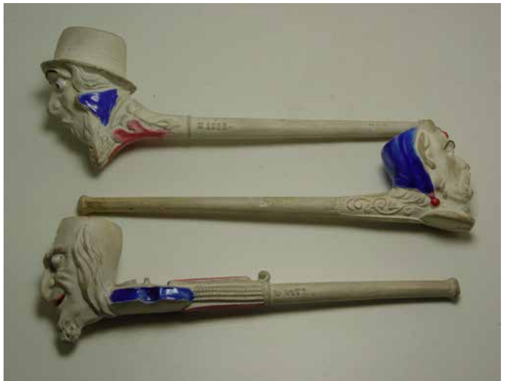
Afb. 10. L'Anglais, Diable en Paganini met Noël merk.

de fabriekssluiting in 1926 doorging. Al deze pijpen werden in de fabriek te Givet geproduceerd. Het is niet precies bekend hoe lang na de overname het bedrijf in Lyon gesloten werd. Uit de vele bodemvondsten uit Givet blijkt duidelijk dat de pijpen met het merk Noël veelvuldig in Givet gemaakt zijn.