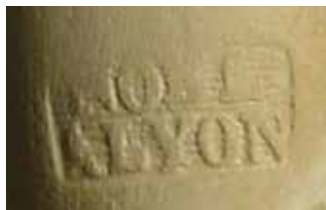
Afb. 4. Steelstempel Noël, in gebruik voor de overname door Gambier in 1890.

de Ardennen. Uit het interview blijkt dat het bedrijf van Noël rond de overname goede resultaten boekte. Ondanks de goede berichten in het interview van 1889 werd het bedrijf van Noël een jaar later overgenomen door Gambier.