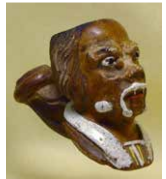
Afb. 2 en 3. Manchetspijpen Noël Frères, Lyon. Coll. P.S.

Nog in 1889 viel Noël tijdens een industriële expositie in de prijzen. Tijdens deze expositie was er een interview gehouden over het bedrijf van Noël en het fabricageproces van hun pijpen wat in een tijdschrift gepubliceerd werd. De tekst van dit interview is vertaald naar het Nederlands en wordt hieronder weergegeven. Deze interessante tekst geeft een kijkje in het bedrijf op het fabricageproces en de werknemers. Het is opmerkelijk om te lezen dat de oprichter van Noël in de Ardennen het vak geleerd heeft en vandaar met enige families werknemers naar Lyon is gegaan. Het lijkt dus zeer waarschijnlijk dat Noël het vak geleerd heeft bij Gambier of Blanc-Garin, de twee grote pijpenfabrieken in