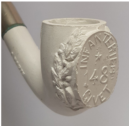
Afb. 2. Tête courbée met de tekst '148e Infanterie Givet'. Modelnr. 2027.

Op de voorzijde van de ketel bevindt zich een groot, ovaal medaillon met een lauwerkrans eromheen. Op de steel van deze pijpen staat in reliëf Gambier a Paris en het modelnummer. Het bijzondere van deze twee pijpen is dat het medaillon een decoratie op bestelling kreeg. In de mal kon aan de voorzijde