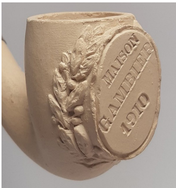
Afb. 5. Tête courbée met opschrift 'Maison Gambier 1910'. Modelnr. 2027.

Een pijp met het opschrift 'Rowing Club Strasbourg 1879' is voorzien van het logo van deze roeiclub uit Strasbourg die opgericht werd in 1879 en nu nog steeds bestaat. Mogelijk is deze pijp besteld voor de leden toen de roeiclub in 1909 het 30-jarig jubileum vierde. De laatste pijp, met het opschrift 'Maison Gambier 1910' (afb. 5) is gemaakt als reclamepijp voor Gambier. Het verschil met de voorgaande pijpen is dat er geen speciale gravering, in het losse deel van de mal die het medaillon vormt, is gemaakt. Er is een vlak medaillon gemaakt waarin de tekst, nadat de pijp uit de vorm kwam, met een los stempel is ingedrukt. Dit in tegenstelling tot de overige pijpen waarop de tekst in reliëf via de persvorm is aangebracht.