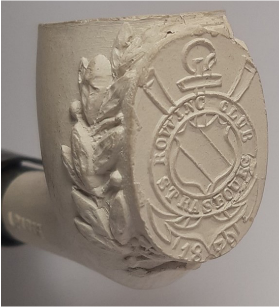
Afb. 4. Tête droite met opschrift 'Rowing Club Strasbourg 1879'. Model-nr. 2026.

het gegraveerde medaillon geplaatst worden. Pijpen gedecoreerd met email konden al langer met naam of tekst besteld worden. Er zijn vele voorbeelden bekend van pijpen met in email de naam van een café of een reclame voor drank, maar ook pijpen met de naam van de eigenaar die op bestelling gemaakt werden. Bij de pijpen met een medaillon waren de productiekosten uiteraard aanmerkelijk hoger, omdat het losse onderdeel van de pijpenvorm met het medaillon gegraveerd moest worden met de aangevraagde tekst of afbeelding.