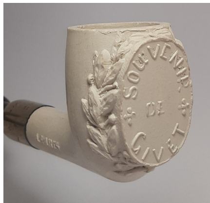
Afb. 3. Tête droite met de tekst 'Souvenir de Givet'. Modelnr. 2026.